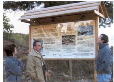
Fotos nº1 i 2: El panell informatiu situat a les immediacions del recinte, posa en coneixement dels excursionistes tant les característiques del projecte com els requisits mínims per tal de garantir la tranquil·litat dels voltors.